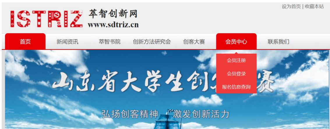
图 3 会员中心注册入口

为便于查询参赛报名结果，所有参赛选手需要先进行“会员注册”，注册后进行登录，然后进入报名环节，报名后可以回到“会员中心”进行“报名信息查询”。具体如图 3、图 4、图 5、图 8 所示。