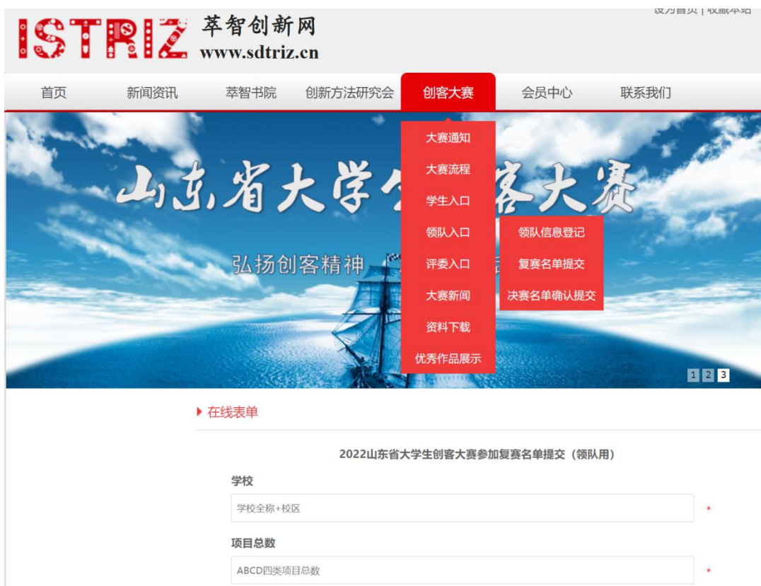
图 11 领队提交复赛名单窗口