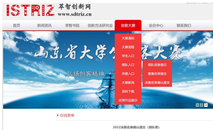
图13 领队确认提交决赛名单窗口

决赛计划在10月中旬的一个周末举行，具体时间、方式与注意事项届时将发布决赛通知，请届时关注大赛官网与大赛QQ通知。