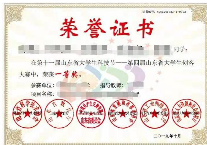
图14 大赛获奖证书样本

一、二、三等奖每个项目发放5张证书；一等奖每个项目另外发放2张优秀指导教师证书。