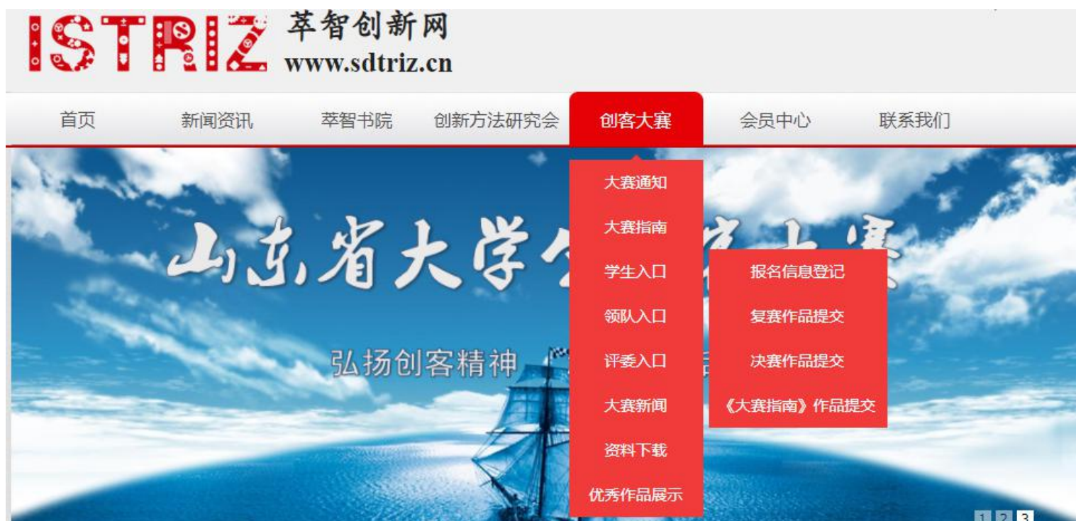
图 6 初赛报名入口