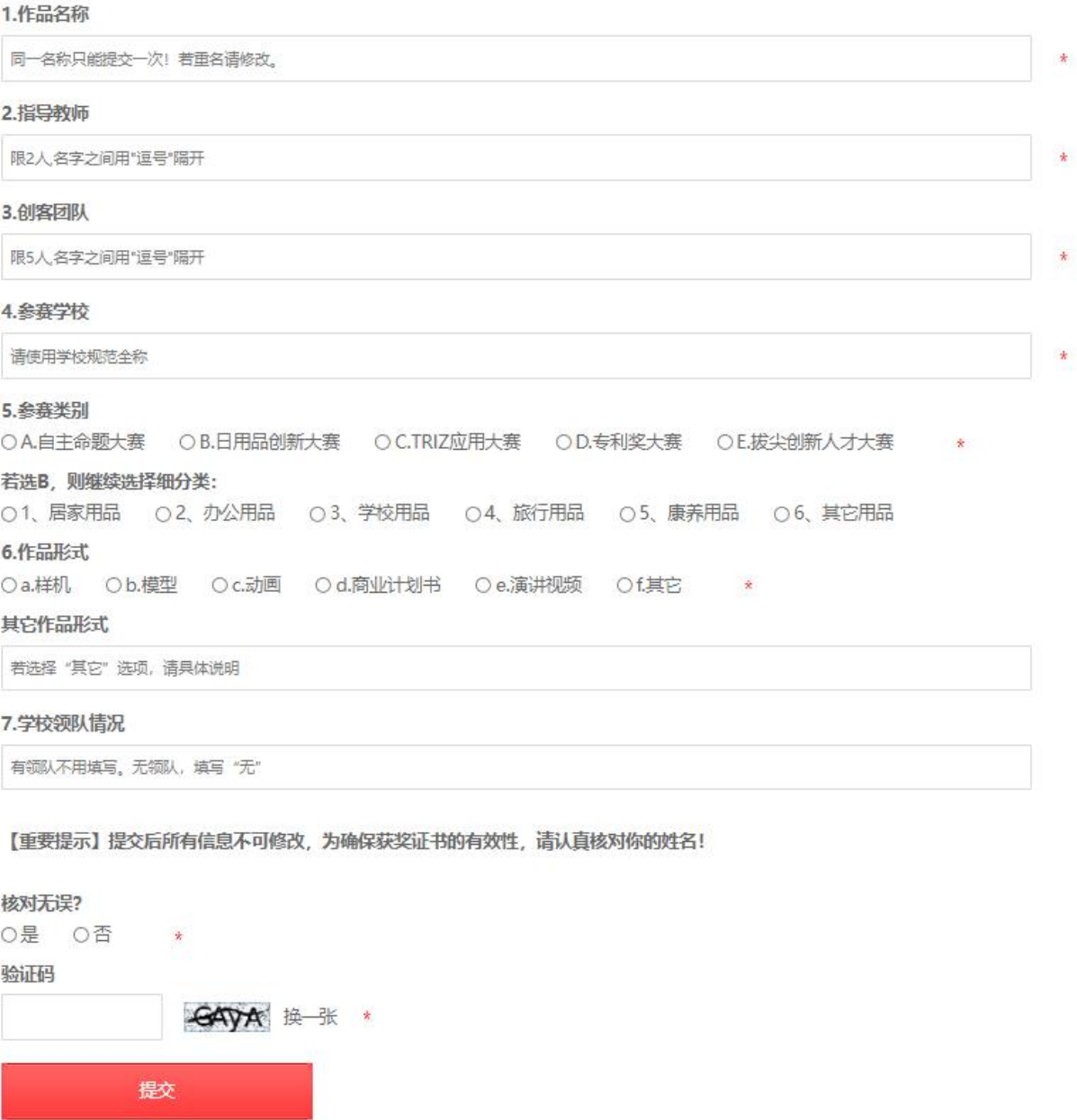
图 7 初赛报名在线表单